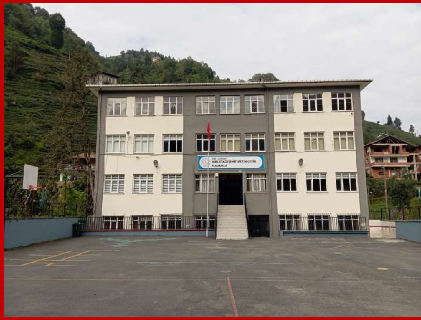
KIBLEDAĞI ŞEHİT METİN ÇETİN İLKOKULU